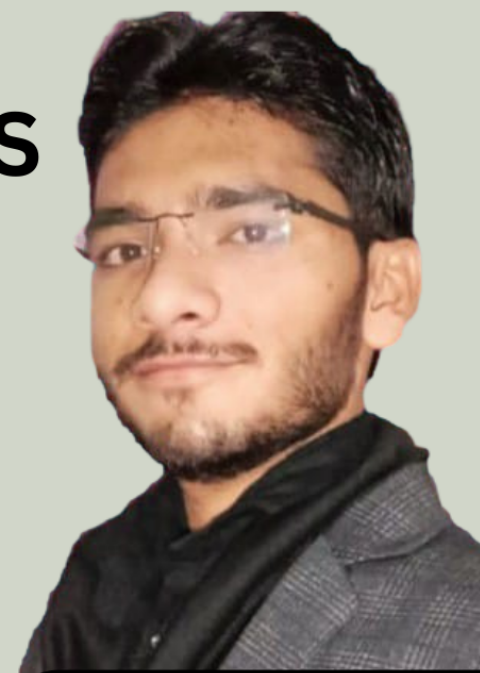
Ram Sir (Founder And CEO)