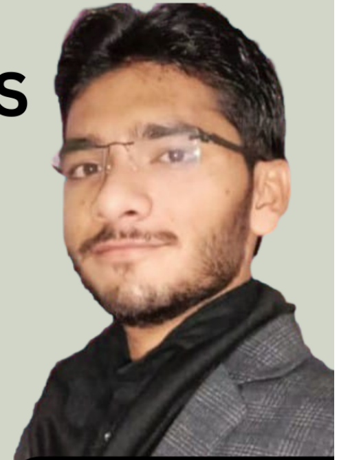
Ram Sir (Founder And CEO)